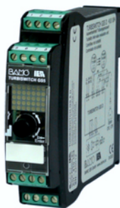
Auswerteeinheit TURBISWITCH GS5 (410-03), seperat erhältlich

Trübung wird durch Partikel in einer Flüssigkeit verursacht. Diese für offene Behälter oder Kanäle konzipierte Tauchsonde TURBISWITCH CP5 misst die Trübung des Mediums optisch.