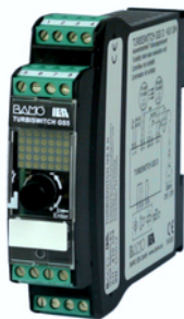
Auswerteeinheit TURBISWITCH GS5 (410-03), seperat erhältlich

Trübung wird durch Partikel in einer Flüssigkeit verursacht. Diese für offene Behälter oder Kanäle konzipierte Tauchsonde TURBISWITCH CP5 misst die Trübung des Mediums optisch.