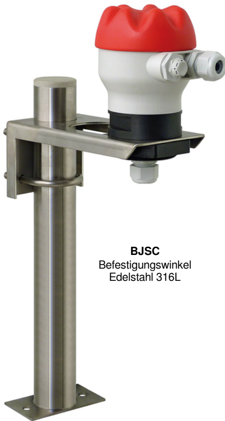
BJSC Befestigungswinkel Edelstahl 316L

Der Edelstahl-Befestigungswinkel ist für die Montage auf einem waagrechten Träger und der PVC-Befestigungswinkel für die Wandmontage geeignet.