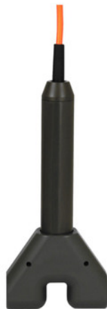
CP5 2 ZO