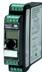
Auswerteeinheit TURBISWITCH GS5 (410-03), separat erhältlich

CE-Kennzeichen: Das Gerät erfüllt die gesetzlichen Anforderungen der zutreffenden EU-Richtlinien