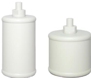
Schwimmer S 78 S 98

*) die Skala ist nicht im Lieferumfang enthalten, sie ist optional zusätzlich erhältlich