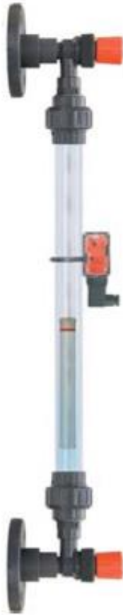
KNR PVC 32 mit Bistabilen Kontakten BSM 502 (* nicht im Lieferumfang enthalten)