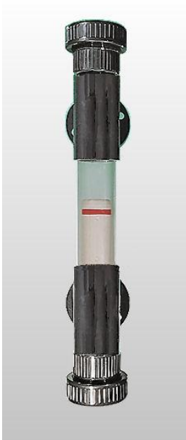
KNR PVC 63