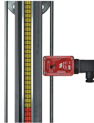
MAGTOP SNAP 101 (optional)