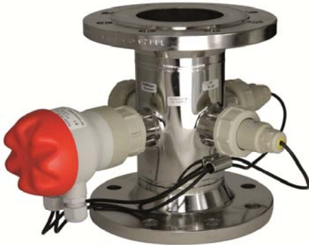
TRUBOMAT GAB... mit Edelstahl-Geberarmatur