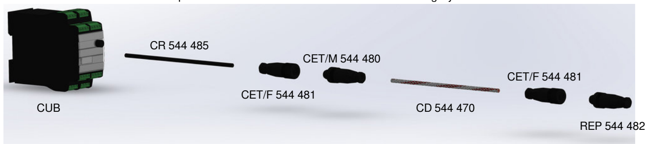
Komponenten des BAMOLEAK-Sicherheits-Überwachungssystems