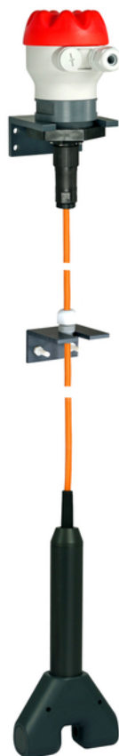
BAMOWIZ Anzeigegerät (optional)